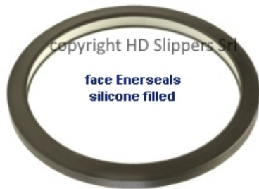
Guarnizioni Energizzate Enerseal® tenuta frontale riempimento in silicone