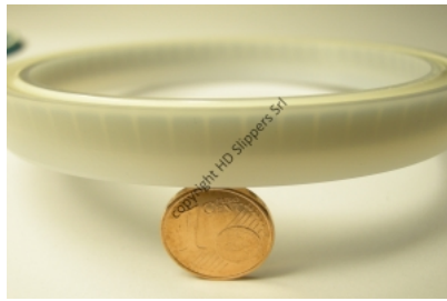
Riempimento in silicone