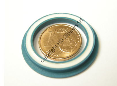
Guarnizioni Energizzate Enerseal®