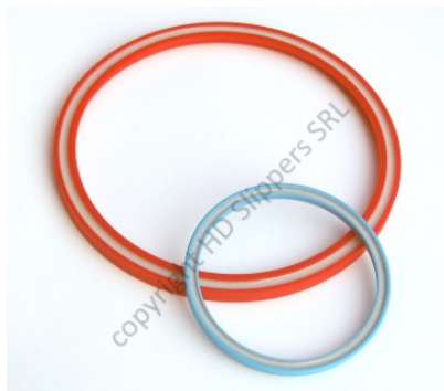
Guarnizioni Energizzate Enerseal® in PU riempimento in silicone