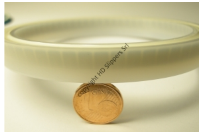
Riempimento in silicone